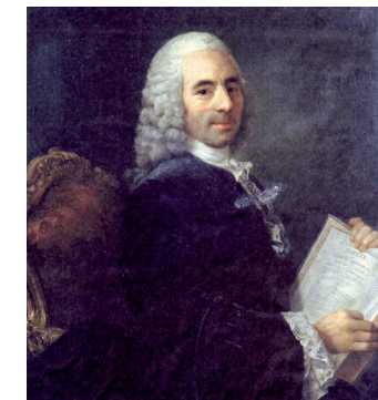
François Quesnay, cirujano y médico de la corte de Luis XV, concibió llevar la noción de la circulación sanguínea de Harvey para la Economía