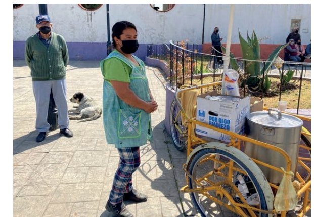
La "necesidad" es la madre de todos los vicios

Romero C. Á. (2022) Ahí va un navío. En: Ahí va un navío. Pág. 95-99. Ed. Palabras y Plumas Editores. México.