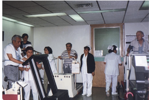
Área de rehabilitación cardíaca