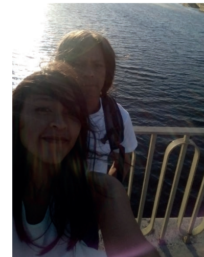
Valle Nacional, Oaxaca

Nos hospedamos en el Centro Ecoturístico Monteflor, un espacio que invita a sumergirse en el entorno natural, rodeado de árboles imponentes y del manantial del mismo nombre. Por las mañanas nadábamos en el manantial y, al regresar, íbamos al comedor, donde una señora preparaba deliciosos platillos acompañados de café de olla. Nos gustaba caminar tomados de la mano, conversar sobre el lugar que descubríamos e incluso reírnos de los ruidos extraños que nos despertaban por la noche, a los que no estábamos acostumbrados.