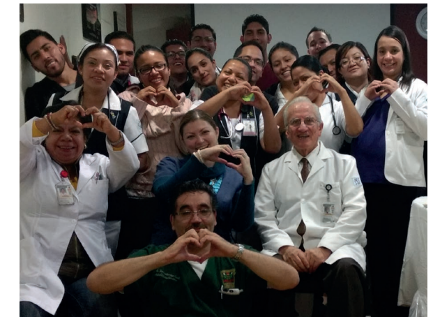
Equipo de rehabilitación cardíaca

A finales del siglo pasado se estructuraron los cursos tutoriales avalados por el propio instituto y la Secretaría de Salud. En la primera década de este siglo se obtuvo el aval universitario para el curso de Rehabilitación y prevención secundaria para cardiólogos (UNAM, 2007 a la fecha), reconocido por el Consejo Mexicano de Cardiología. Asimismo, se instauró el diplomado para fisioterapeutas (UNAM, desde 2013). Estos dos programas han capacitado a más de un centenar de egresados, quienes ejercen en