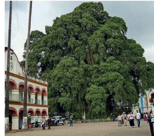
Árbol del Tule, Oaxaca

A Lalo le gustaba disfrutar de las cosas que, en su sencillez, hacen la vida mejor: una tarde luminosa, un lugar tranquilo, un buen mezcal o una noche estrellada, vista desde cualquier rincón del país.