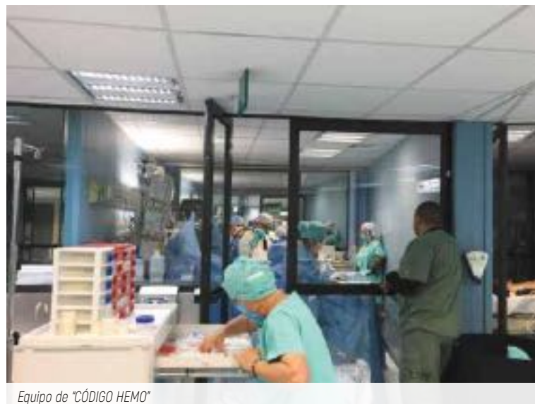
Equipo de "CÓDIGO HEMO"

¡Solo piénsalo por un momento! Un poco de sangre tuya puede salvar una vida, imagina lo que haría un poco más de ella, ¿cuántas vidas salvaría? , la principal motivación para donar debe