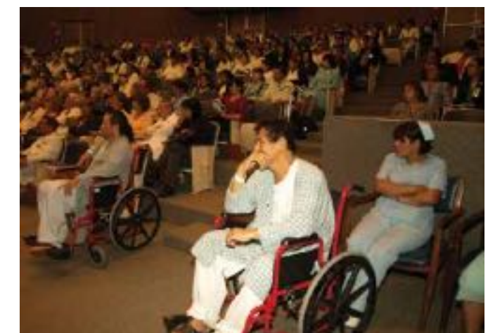
Los conciertos en el Instituto Nacional de Cardiología Ignacio Chávez han dado solaz y esparcimiento a enfermos, médicos, enfermeras, bioquímicos y público en general.

En el siguiente número continuaremos revisando la estupenda labor realizada en la organización de estos conciertos. ♥